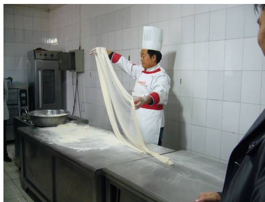
Participation à un cours de cuisine du Shaanxi