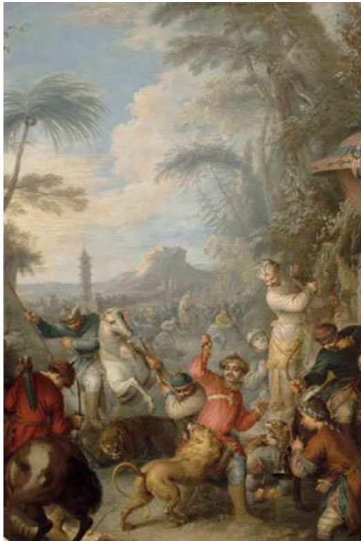
La Chasse chinoise de Jean-Baptiste Pater, 1736

L'exposition retrace l'histoire des échanges politiques et artistiques entre la Chine et la France au XVIII e siècle. Les peintures, meubles, laques, porcelaines et tapisseries exposés témoignent du plus grand luxe de leur époque et sont d'une extrême rareté aujourd'hui.