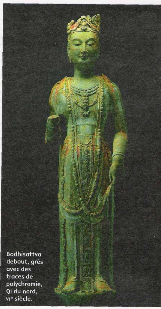
Bodhisattva debout, grès avec des traces de polychromie, Qi du nord, VI e siècle.