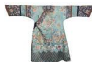
Robe de femme, Chine, fin 19 e

« La Chine au féminin. Une aventure moderne » vous embarque dans un voyage original à la découverte des femmes chinoises durant le siècle le plus tourmenté de l’histoire de Chine, entre guerres et révolutions, le 20e siècle. Véritable fresque sociale, l’exposition dresse l’évolution de cette aventure au féminin : femme travailleuse, femme combattante, femme modèle ... Elle propose in fine un portrait renouvelé de la femme moderne, loin des stéréotypes hérités de la fin du 19e.