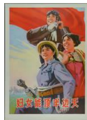
Les femmes portent la moitié du ciel sur leurs épaules, affiche de propagande, 1974

Musée royal de Mariemont Chaussée de Mariemont, 100 7140 Morlanwelz Belgique