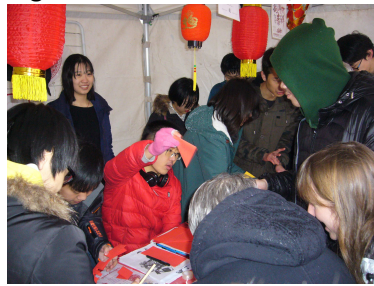
Les étudiants de l'IUT du Montet