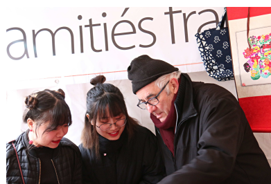
Au stand de l'association