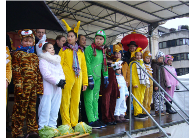
Les traditionnels dragons et lions-licornes ; les animaux du zodiaque