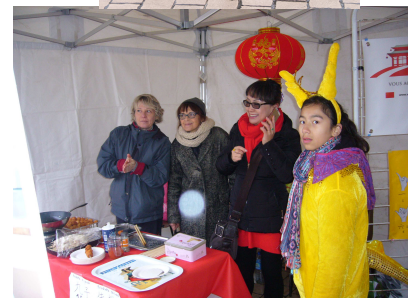
La vente des brochettes