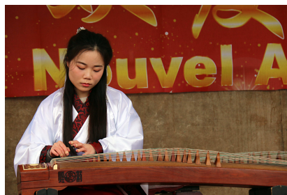
La Chine entre traditions et modernité : guzheng et rap...