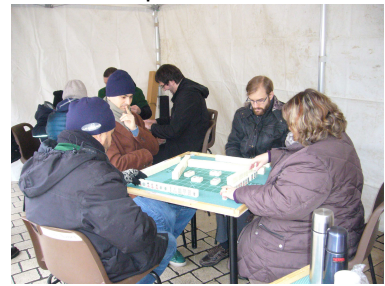
Au club Mah-jong